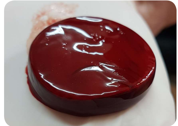
Sản phẩm ActiGraft